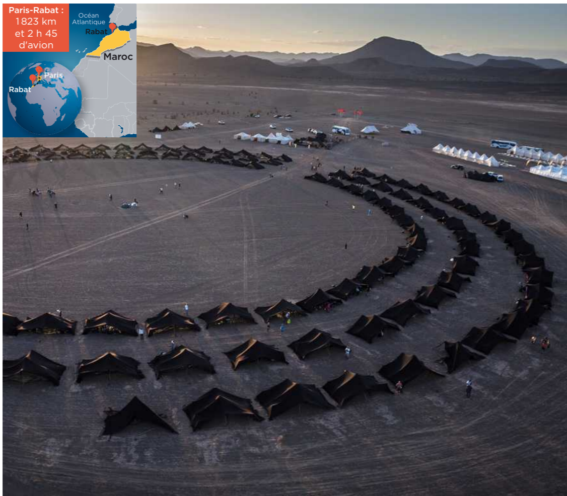
Le soir, les participants partageaient des tentes typiques de la région, dans des bivouacs comme celui-ci, près de Tinghir, le 7 avril. Ceux qui voulaient manger chaud devaient faire leur propre feu.