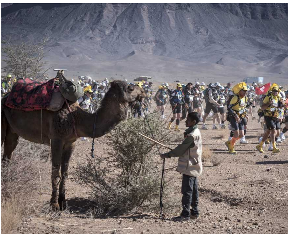
Tout le monde avait le droit de participer à la course. Les meilleurs (des professionnels, dont le sport est le métier) couraient à environ 15 km/h, tandis que des amateurs marchaient à moins de 5 km/h.